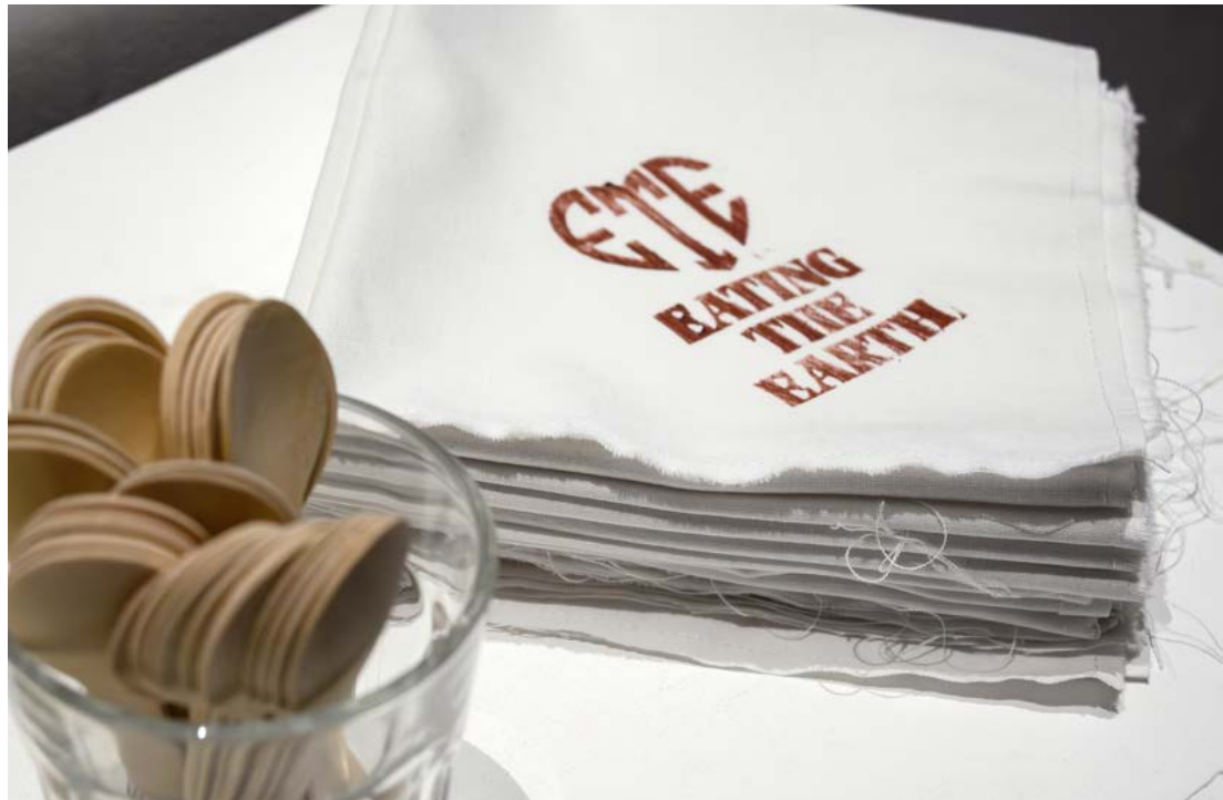
In der Life Performance Eating the Earth wurde Torf zu Pralinenmasse verarbeitet und serviert. Das Dessert, mit assoziativen Wortkombinationen gereicht, präsentierte sich als köstliche Verlockung und nachdenkliche Kost.